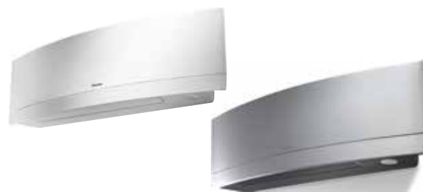
Unité intérieure murale EMURA FTXR