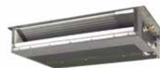
Unité intérieure gainable FDXS et CDXS