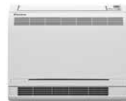
Unité intérieure console FVXS